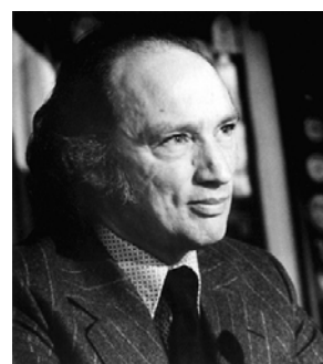
11. Pierre-Elliott Trudeau, premier ministre du Canada de 1968 à 1979 et de 1980 à 1984.