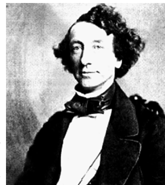
1. Sir John Alexander Macdonald présida le premier cabinet canadien de 1867 à 1873 avant de revenir au pouvoir de 1878 à 1891.

Le renseignement de sécurité ne date pas d'hier. On en retrouve des allusions dans des écrits aussi anciens que l'Ancien Testament, où les puissances du mal tentaient de corrompre la foi des juifs et où Noé, de son bateau, envoya une colombe recueillir des informations pour son compte. Par ailleurs, bon nombre de nos légendes et contes font allusion aux tromperies, supercheries et infiltrations qui caractérisent encore aujourd'hui certains services de renseignement. Mais au Canada, les premiers pas du renseignement de sécurité apparurent le 17 décembre 1864 avec la création de la Western Frontier Constabulary par le Premier ministre de l'époque, Sir John A. Macdonald, «the man who surely be regarded the original Canadian champion of law and order» 5 .