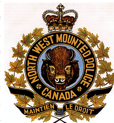
5. Le logo de la Police à cheval du Nord-Ouest, dont les principales caractéristiques ne changeront que très peu au fil des ans.

de sécurité d'importance. En effet, c'est à l'occasion de cette ruée vers l'or que la Police à cheval du Nord-Ouest «entreprit, dans le cadre de ses fonctions policières, une importante collecte de renseignements pour la sécurité. [Elle] fut appelée à enquêter sur des rumeurs de complots américains pour annexer le territoire du Yukon» 24 . Ces opérations de renseignement impliquèrent notamment l'infiltration de l'Ordre du Soleil de Minuit ( Order of the Midnight Sun ), une organisation américaine de mineurs potentiellement dangereuse. C'est Fred White, le représentant de la Police à cheval du Nord-Ouest à Ottawa, qui fut le directeur de ces opérations. Les résultats de ces enquêtes permirent au gouvernement canadien de prendre les mesures préventives nécessaires.