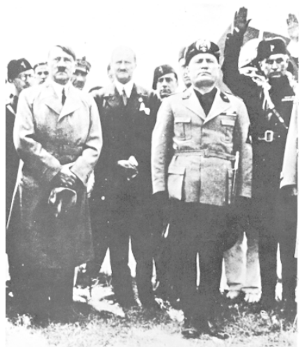
8. La première des grandes entrevues diplomatiques entre le Führer Adolf Hitler et le Duce Benito Mussolini (fin des années 1930).

Ce service secret s'était doté d'une politique voulant que, contrairement aux services secrets des principaux pays alliés du Canada, les activités des agents de renseignement étaient strictement limitées aux frontières canadiennes. Pour obtenir des renseignements sur les États étrangers, la GRC recourrait aux sources ouvertes (les sources d'informations publiques comme les agences de presse et les médias d'information) ou à ses alliés avec qui elle avait développé de bonnes relations, notamment les États-Unis et la Grande-Bretagne.