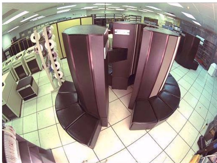
14. Un modèle de superordinateur Cray-1 XMP.

Par ailleurs, rendant compte au Comité du Cabinet chargé de la sécurité et des renseignements et hiérarchiquement dépendant du coordonnateur de la sécurité des renseignements existe le Centre de la sécurité des télécommunications (CST). Ce centre, «dont aucune loi ne limite les immenses capacités de surveillance et d'intrusion dans la vie privée des citoyens, possède [...]