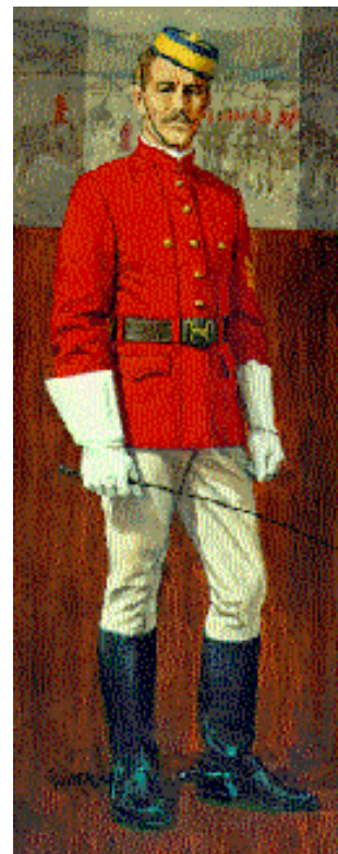
2. Un agent de la Police à cheval du Nord-Ouest en 1873.

«La concurrence [chez les commerçants de fourrure] avait amené les petits commerçants indépendants à faire la traite du whisky, ce qui était désastreux pour les indigènes. La première mission de la Police à cheval consistait donc à éliminer ce trafic d'alcool avant qu'il ne dégénérait en guerre entre les Indiens et les Blancs» 16 . Cet objectif resta longtemps dans l'énoncé de mission de la Police à cheval du Nord-Ouest mais son devoir général était «le maintien de la paix, la prévention du crime et des offenses contre la loi et les ordonnances en vigueur dans le [sic] Territoires du