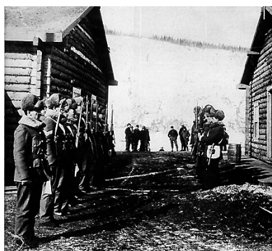
4. Un poste de la Police à cheval du Nord-Ouest au Yukon, vers 1899.

prime abord, que ce territoire faisait clairement partie du Yukon et donc du Canada. Mais la proximité de la frontière avec l'Alaska, le grand nombre d'Américains vivant au Yukon et l'isolement de cette région du reste du Canada avaient de quoi rendre nerveux les autorités canadiennes. En effet, certaines rumeurs commençaient à circuler, concernant une éventuelle invasion du territoire canadien par les Américains.